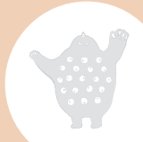
VRブース or ぬりえブース